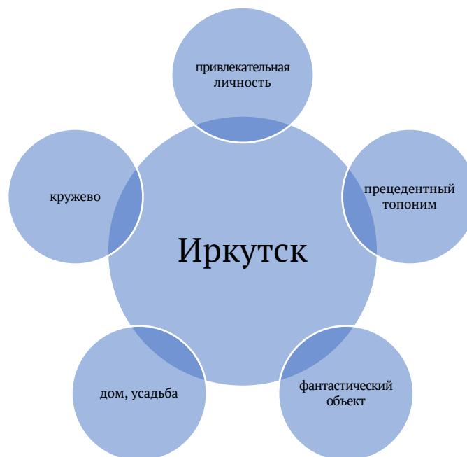
Рисунок 1. Основные концептуальные метафоры в информационно-рекламных текстах об Иркутске