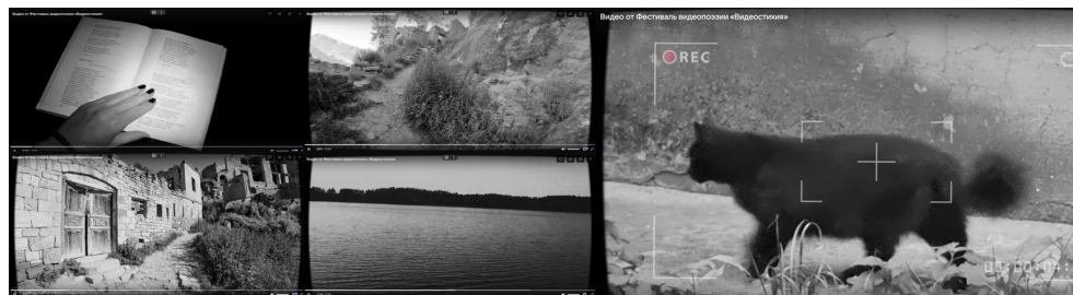
Рисунок 1. А. Грузкова «Есть игра: осторожно войти...»