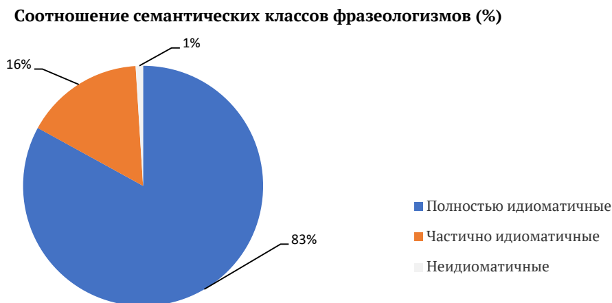
Рисунок 3. Соотношение семантических классов фразеологизмов

Подводя итог семантической классификации номинативных фразеологизмов, следует обратиться к методике количественного подсчета данных, результаты которого представлены на Рисунке 3.