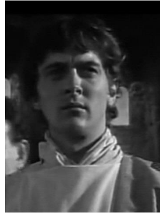
Изображение 1. Гутрум и Король Альфред. Кадры их кинофильма «Альфред Великий», реж. К. Доннер, 1969 год

Столкновение двух религий находит реализацию в проявлении силы богов в войне, при этом для первого из них – это захватническая война ( to take the land (захватить землю)), для второго – освободительная ( to stop the Danes (остановить данов)). Фрактальное движение концепта «spiritual power» соотносится с этапами войны; вербальную репрезентацию получает семантическое образование «война», где значимыми являются бинарные оппозиции « the Danes (дань) / the Saxons (саксы)», « sons of Odin (сыновья Одина) / Christians, freemen (христиане, свободные люди)», « take the land (захватить землю) / stop the Danes (остановить данов)» для двух фрактальных ветвей. Последовательно актуализируются другие значимые для реконструкции концепта смысловые элементы, непосредственно связанные с сюжетной линией. Некоторые из них получают достаточно объемную репрезентацию в виде совокупности вербального и невербального представления и обнаруживающихся ассоциативных связей таким образом, что можно рассматривать данные смысловые образования как элементы последующего уровня фрактальной самоорганизации концепта с видимыми аттракторами.