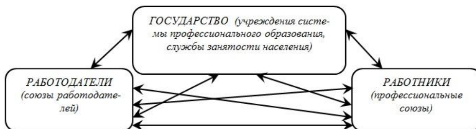
Рис. 3. «Идеальная» схема взаимосвязей субъектов российского рынка труда в современных условиях

Проведенный анализ данных Рисунка 1 позволяет сделать вывод о том, что взаимосвязи указанных субъектов рынка труда недостаточно развиты, в связи с этим необходимы их регулирование и координация. Для этого нужно перейти от слабых взаимосвязей субъектов рынка к сильным, от «реальной» модели их взаимосвязей – к «идеальной» (Рисунок 3).